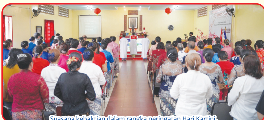
Suasana kebaktian dalam rangka peringatan Hari Kartini.