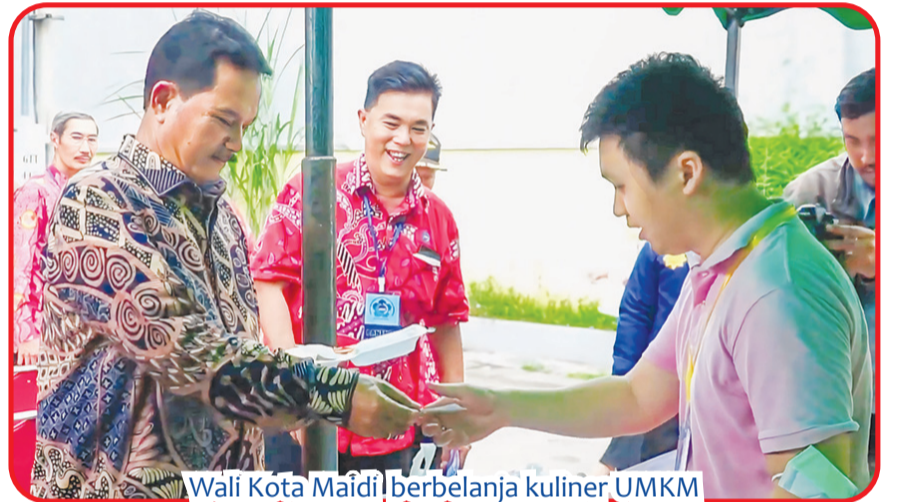
Wali Kota Maldi berbelanja kuliner UMKM