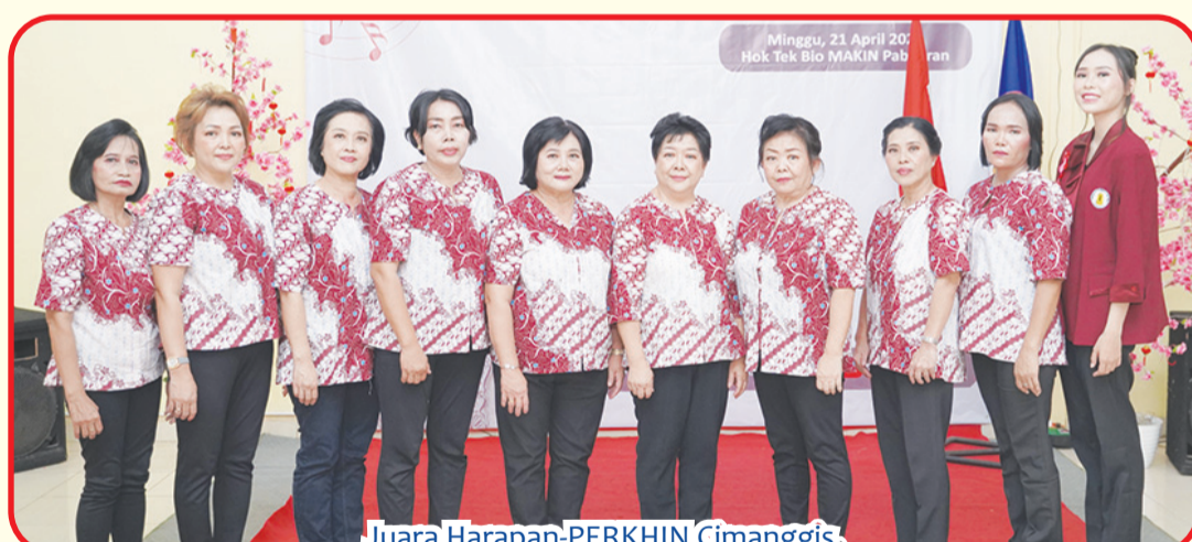
Juara Harapan-PERKHHN Cimanggis.