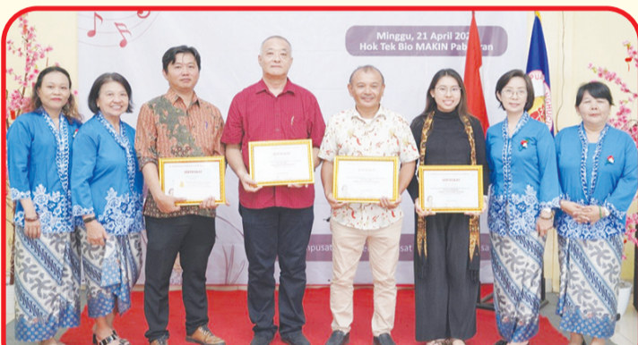
Pemberian piagam penghargaan kepada dewan juri lomba dan sponsor acara.