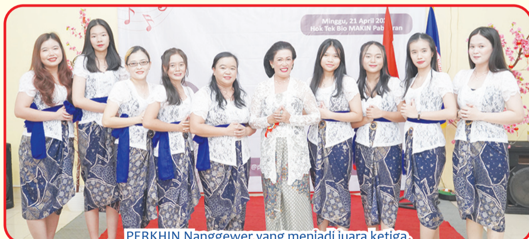
PERKHHN Nanggewer yang menjadi juara ketiga.