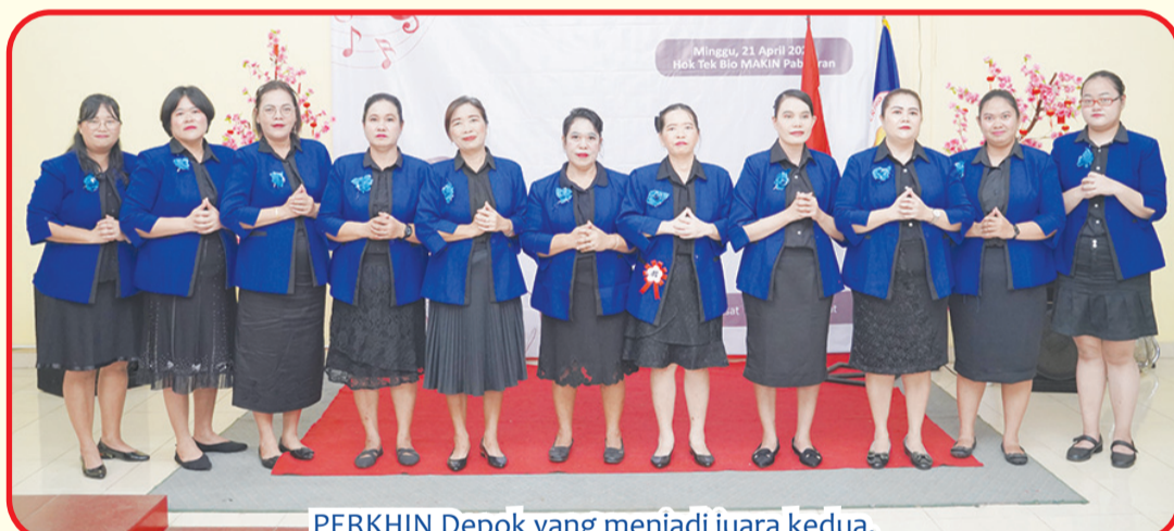
PERKHHN Depok yang menjadi juara kedua.