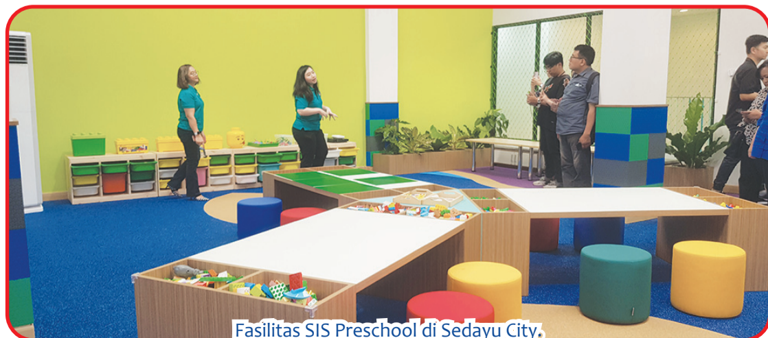
Fasilitas SIS Preschool di Sedayu City.